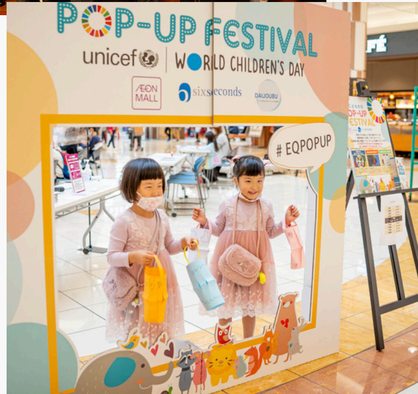
AEON MALL, Kansai-area, JP, 2021.