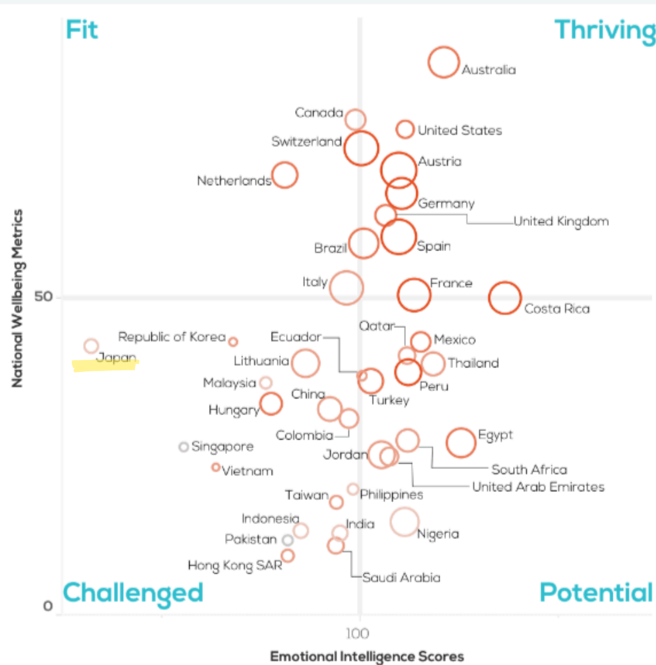
State of Heart 2018 GLOBAL, Six Seconds