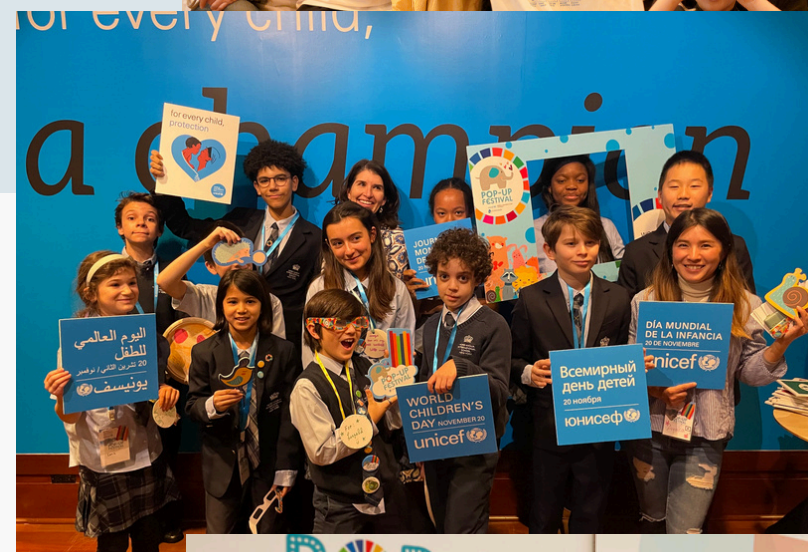
UNICEF, NY, USA, 2023.