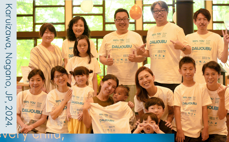
Karuzawa, Nagano, JP, 2024.